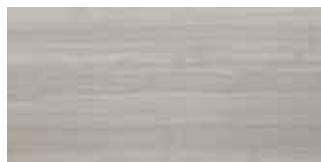
PL 15 30x60 12"x24" 073