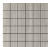
Mosaico / PL 15 30x30 12"x12" 180