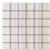
Mosaico / PL 5 30x30 12"x12" 180