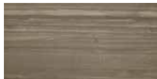
PL 9 30x60 12"x24" 073