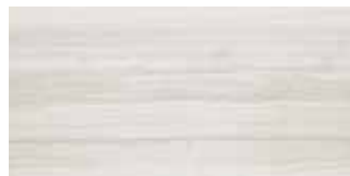
PL 5 30x60 12"x24" 073